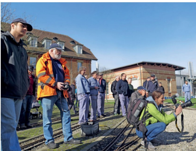
Gebannt warten alle Teilnehmer der Vernissage auf das Rollout der umgebauten Lok.