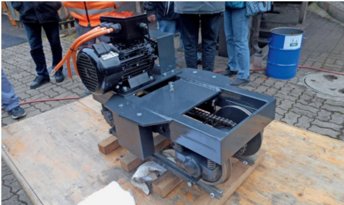
Ein Drehgestell mit neuem Motor konnten die interessierten Mitglieder am Neujahrshöck 2018 bestaunen.