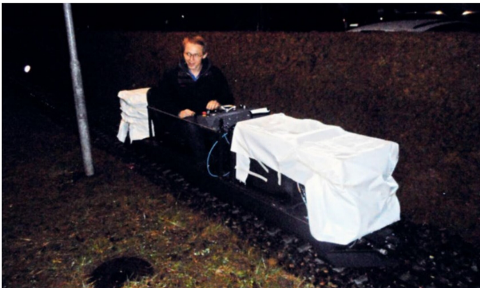
Der «Erlkönig» MOB Ge 4/4 8004 im Februar 2018 auf nächtlicher Probefahrt.