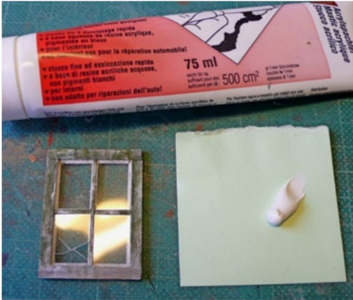
Nach dem Grundieren kommt die Verglasung inklusive Kittverfugung dran.