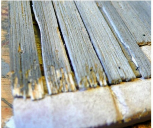
Ausgefrante Brettenden werden mit dem Skalpell vorsichtig eingezitt.