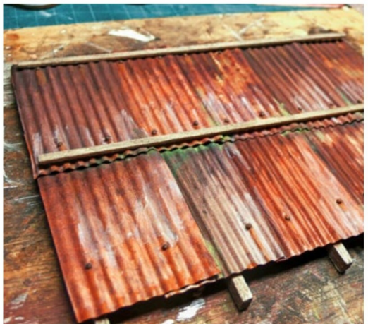
... glänzt das Ganze zu stark. Abhilfe schafft auch hier Puderfarbe.