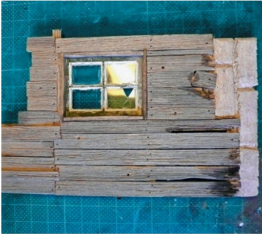
Puderfarben und Farbe aus einem Schulkasten kommen zum Einsatz.