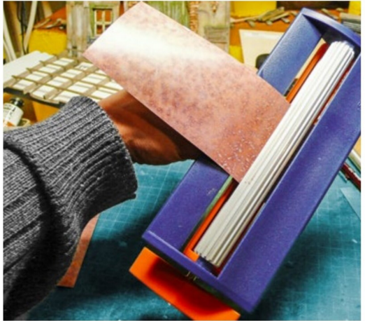
Eine solche Prägerolle gibt es im Bastelbedarf. Gut geeignet für Wellblech.