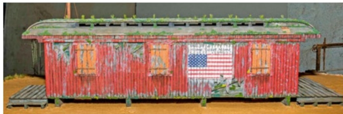
Go West: Arthur Schmidheiny wird sein Diorama mit dem Titel «Azgy's Pinup» zeigen.

14. April, 11.00–18.00 Uhr (Konzert ab 20.00 Uhr; Eintritt CHF 8.–). 15. April, 10.00–17.00 Uhr