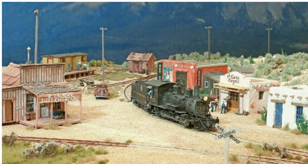
Eine interessante Anlage wird die der H0n3 AMORS – einer losen Gruppierung von Modellbahnern – mit typisch amerikanischen Motiven sein.