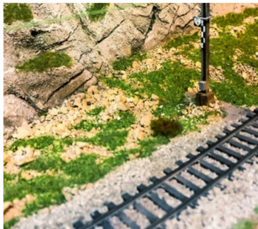
Der liebevoll gestaltete Bereich zwischen Gleis und Felswand überzeugt.