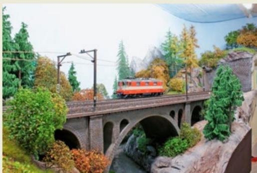
Die Fahrleitung wird montiert und auch sofort immer getestet.