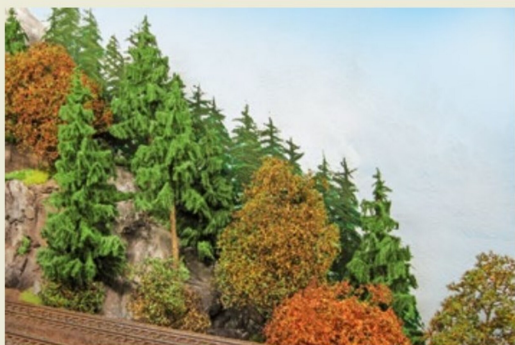
Die Fichten im Hintergrund sind farblich an die im Vordergrund angeglichen.