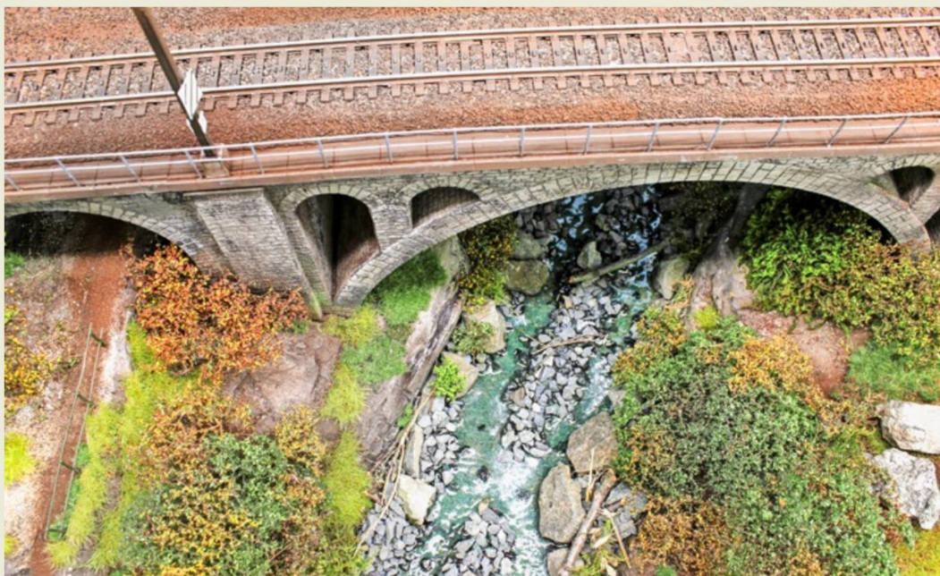
Während des Modellierens meines Wildbaches nutzte ich zur besseren Orientierung immer viele Vorbildfotos. Das Resultat lässt sich sehen!