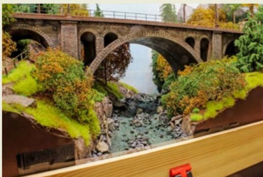
Vorderste Kante ist sehr gut abgedichtet, nun kann das Gießharz fließen.