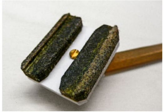
Die Unterseite mit den beiden seitlichen Führungsbacken.