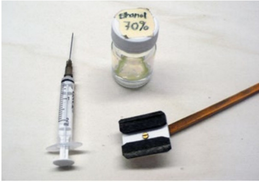
Alle für die Reinigung benötigten Utensilien.