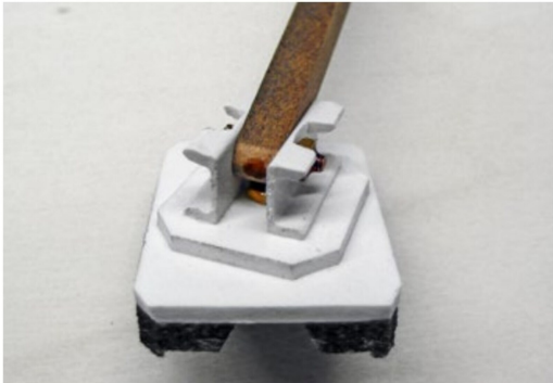
Der Schienenreiniger ist auf alle Seiten schwenkbar.