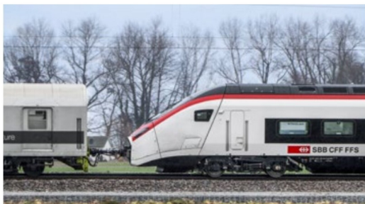
Die Verbindung zwischen dem Giruno-Kopf und dem Kupplungs- und Bremswagen von RailAdventure einmal im Detail.