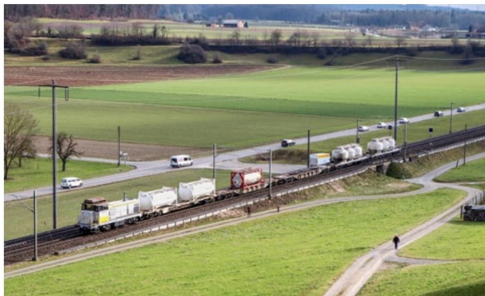
Weil am 26. Januar die 487 001 mit einer Giruno-Überfuhr beschäftigt ist, kommt die Bm 840 416 für die Anbindung von Rekingen an den RBL zum Einsatz. Hier mit fünf Wagen zwischen Glattfelden und Eglisau.

Dafür war die Bm 840 416 am 8. Februar zu beobachten, wie sie die Em 3/3 18814 der Stiftung Museumsbahn (SEHR & RS) von Etzwilen nach Rümlang überführte. TK