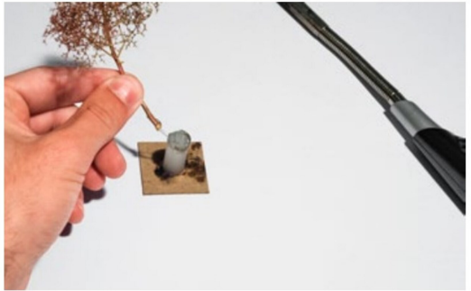
Das Ende des Seeschaumstücks wird in den flüssigen Heissleim gedippt...