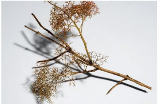
... Schritt für Schritt ...