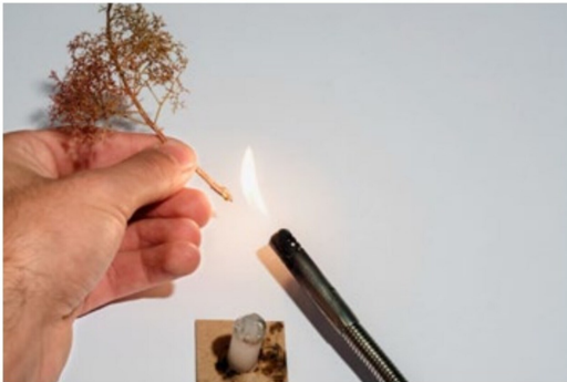
... die entstehenden Heissleimfäden mit dem Feuerzeug abgetrennt ...