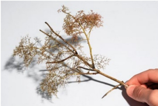
Mit dieser Herangehensweise entsteht nun ...