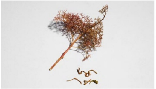
Der Seeschaum wird von allfälligen Blätterresten gesäubert.