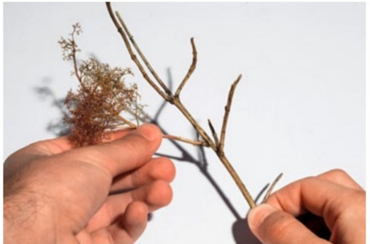
... und an den Stamm oder einen seiner Ableger angeklebt.