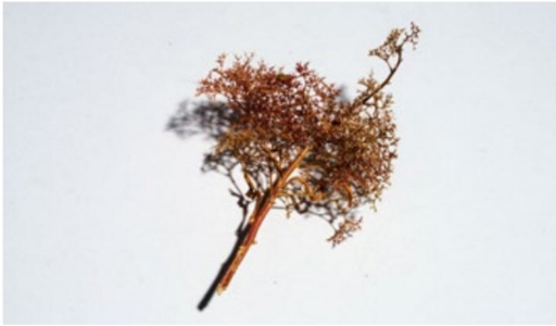
Ein Seeschaumstück, welches für einen «Patchwork»-Baum geeignet ist.