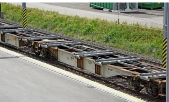
Der Blick auf einen unbeladenen Tragwagen zeigt die zusätzlichen Rahmen für den horizontalen Verlad der Wechselbehälter.