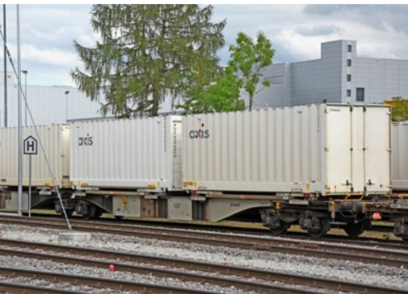
Typenbild eines Doppeltragwagens Sggmrss. Gut sichtbar sind die horizontalen Streben auf den Seitenwangen im Bereich der Containerverschubbahnen.