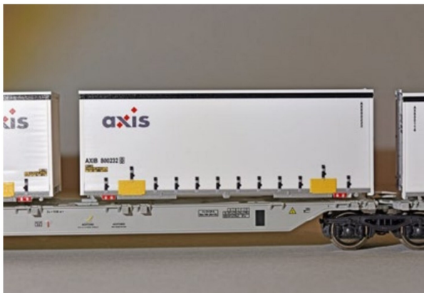
Auf dem Roco-Modell sind die technischen Angaben sauber aufgedruckt. Auch die axis-Container sind lupenrein bedruckt.