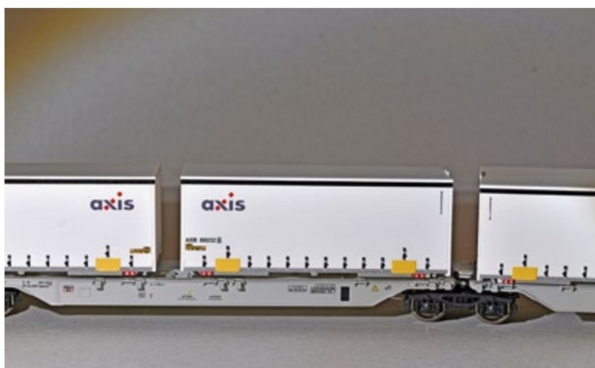
... und das nicht minder interessante Abbild im Modell. Die horizontalen Verstärkungsstreben sind dem Container aufgedruckt.