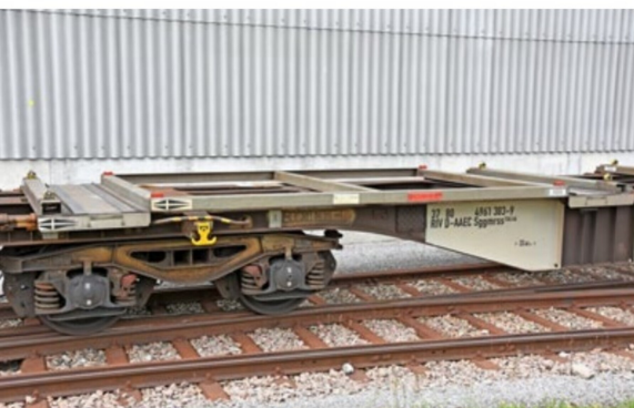
Diverse Details des AAE-Tragwagens mit den horizontalen Verstärkungsstreben zur Aufnahme der Container im Original...