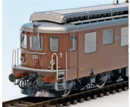
Die montierten Scheibenwischer befinden sich auch im Zurüstbeutel.

Ist beim Anbringen von Zurüstteilen eine Verklebung sinnvoll und mitunter erforderlich, auch wenn der Hersteller in der Betriebsanleitung dazu keine Angaben macht, ist die Wahl des Klebstoffs von grosser Bedeutung. Die bis dato besten Erfahrungen habe ich mit dem Uhu-Kraftkleber ohne Lösungsmittel gemacht. Dadurch werden weder die Lackierung des Fahrzeugs noch die Kunststoffgehäuse beschädigt, wie dies bei Cyanacrylatprodukten, bekannt unter den Bezeichnungen Super- oder Sekundenkleber, der Fall ist. Selbst wenn beispielsweise bei einer Griffstange zu viel Kleber aufgebracht wurde, lässt sich dieser auch noch am nächsten Tag mit einem Zahnstocher entfernen.