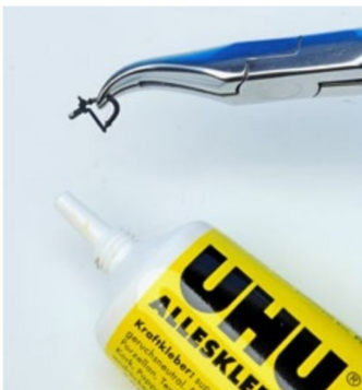
Ein Tropfen Kleber am Bremschlauch reicht.

Ist beim Anbringen von Zurüstteilen eine Verklebung sinnvoll und mitunter erforderlich, auch wenn der Hersteller in der Betriebsanleitung dazu keine Angaben macht, ist die Wahl des Klebstoffs von grosser Bedeutung. Die bis dato besten Erfahrungen habe ich mit dem Uhu-Kraftkleber ohne Lösungsmittel gemacht. Dadurch werden weder die Lackierung des Fahrzeugs noch die Kunststoffgehäuse beschädigt, wie dies bei Cyanacrylatprodukten, bekannt unter den Bezeichnungen Super- oder Sekundenkleber, der Fall ist. Selbst wenn beispielsweise bei einer Griffstange zu viel Kleber aufgebracht wurde, lässt sich dieser auch noch am nächsten Tag mit einem Zahnstocher entfernen.