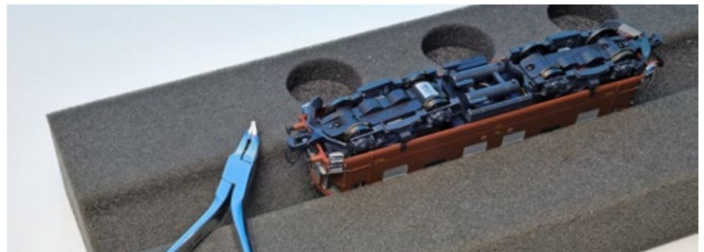
Eine Lokliege ist ein hilfreiches Utensil beim Zurüsten von Loks und Wagen.