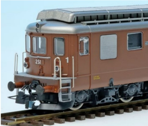
Die Ae 4/4 von Roco hat im Lieferzustand beidseitig Kupplungen.