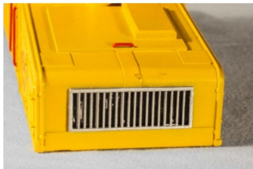
Die Lokfront erhält einen Kühlergrill, welcher silbern gehalten wird.