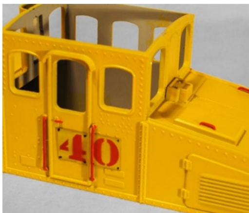
Die andere Lokseite weist leicht andere Wartungskappen auf.