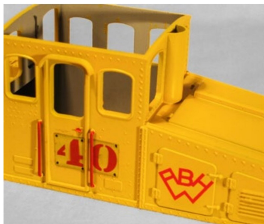
Die Geländer und Türfallen werden zur besseren Kennung farblich abgesetzt.