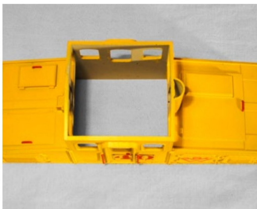
Nach dem Aufbringen der Farbe wirkt der Kasten wie aus einem Guss.