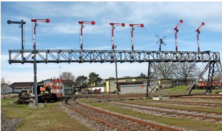
Einzige erhaltene Signalbrücke der Schweiz. Sie stand von 1913 bis 2003 im Bahnhof Romanshorn.

Weitere technische Kulturgüter der Bahn sind die Drehscheibe, ein Wasserkran, ein