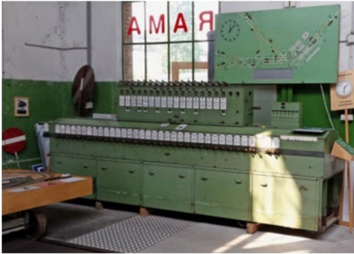
Befehlsstellwerk Romanshorn mit Gleisbildtafel darüber.