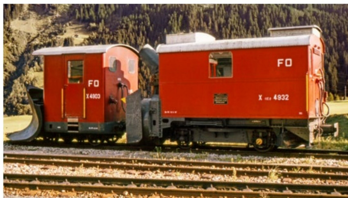
Am 30. Juni 1989 stehen X 4903 und X rote 4903 für winterliche Aufgaben bereit.