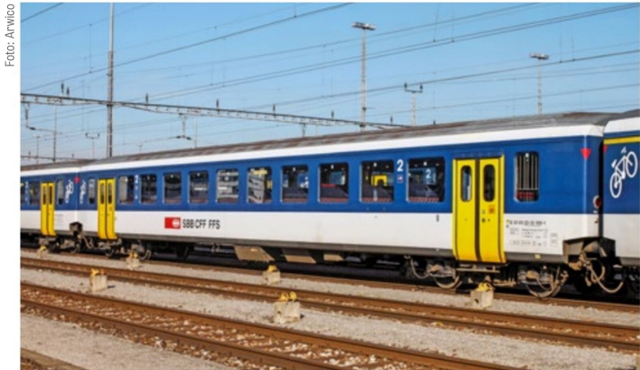
Die lange Einsatzzeit beim Vorbild beschert uns viele Varianten im Modell. Hier in NPZ-Lackierung.