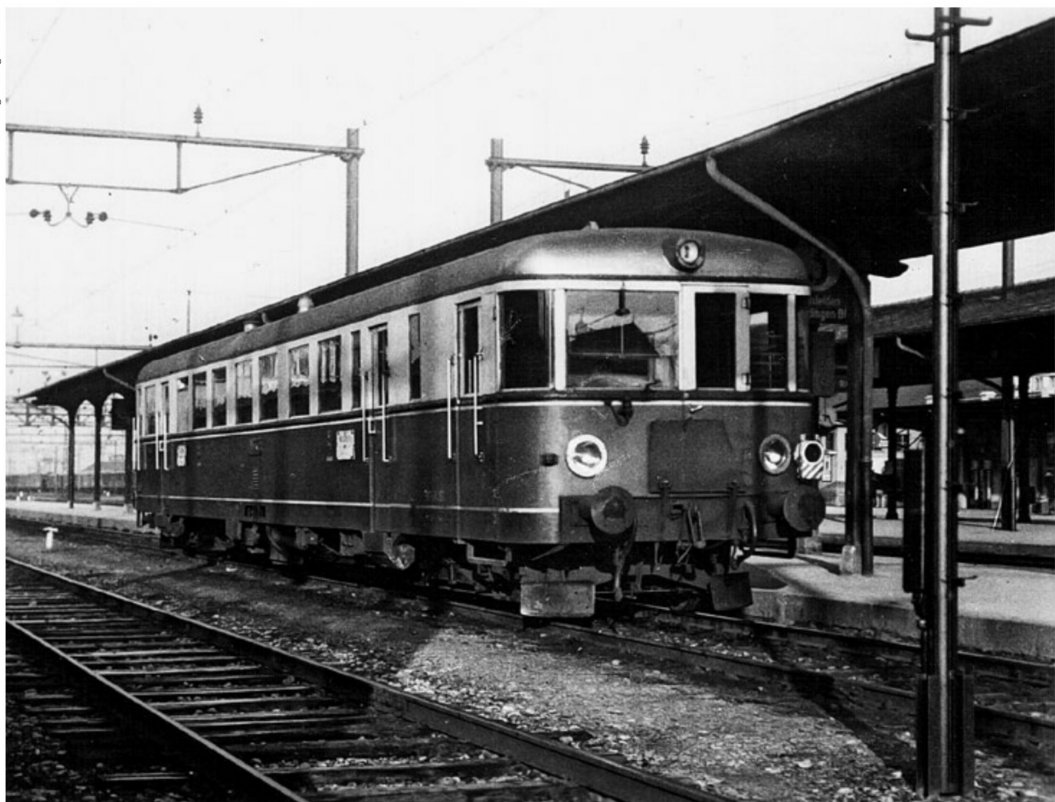
Der Dieseltriebwagen mit einer Leistung von 300 PS der MThB war einer der ursprünglichen BCFm 2/4 Nr. 251/252 von 1941/42.