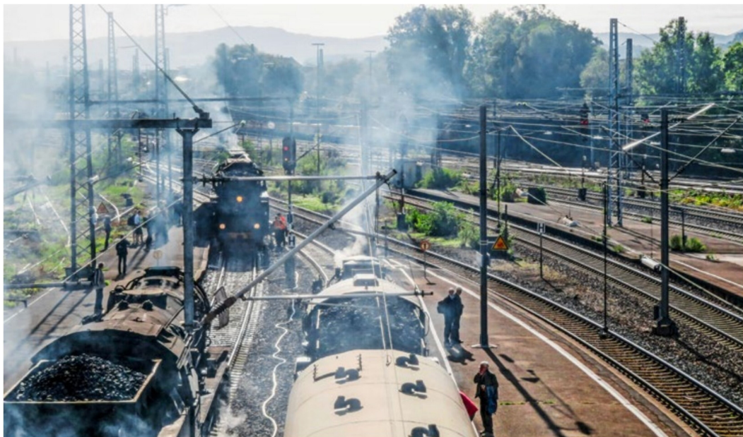
Eindrückliches Dampflokentreffen am Bahnhof Göppingen, wo es raucht und zischt. Noch ist der Überraschungsgast aus der Schweiz unterwegs.