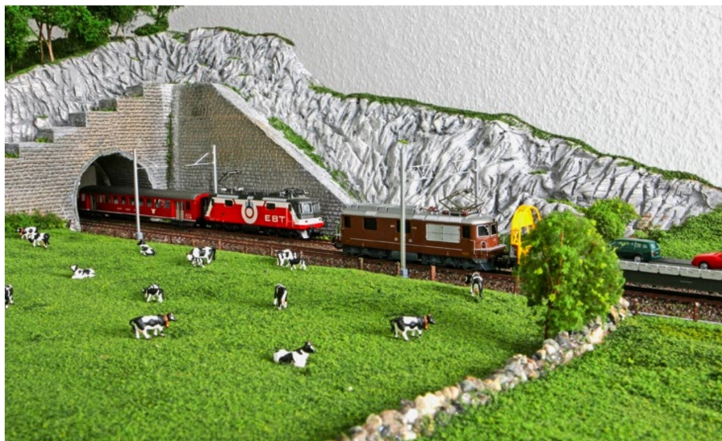
Vor dem Tunnelportal ist die Spezialausführung der Fahrleitungsmasten für ein niedrigeres Lichtraumprofil zu sehen.