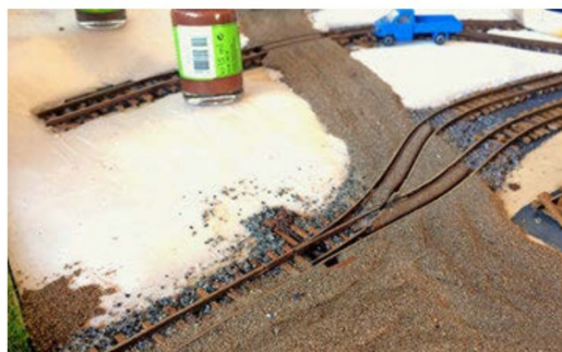
... nach dem Einschottern und dem Bau des Weges kaum noch zu sehen sind.