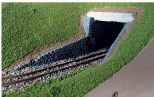
Blick auf das Tunnelportal nach dem ersten Begrünungsauftrag.