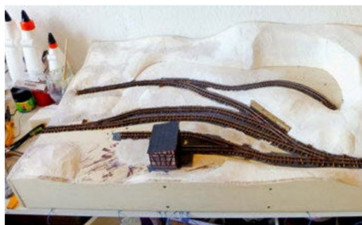
Der Landschaftsrohbau. Zu erkennen: die Sandgrube mit 50°-Böschungswinkel.