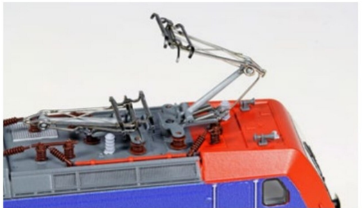
Neu sind ebenfalls die vier unterschiedlichen Pantografen der N-482.