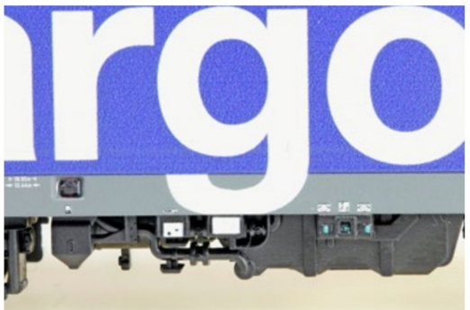
... wie auch im Kleinen, und das wohlbermerkt im Massstab 1:160.