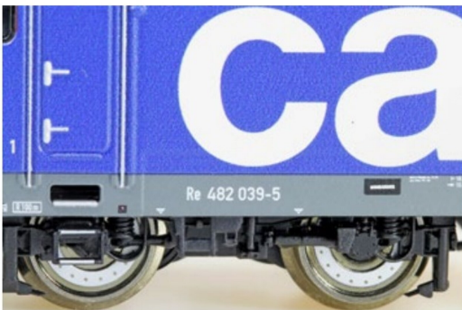
Weitere feine Druckdetails: Da fehlt wirklich nichts, im Grossen ...