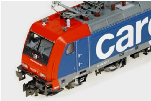
Werkseitig ist das Modell mit der Fleischmann-«Profikupplung» ausgerüstet.