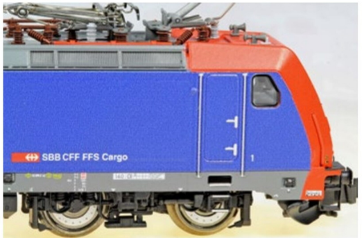
Äusserst saubere Farbtrennlinien und exakt bedruckte Brems scheiben.