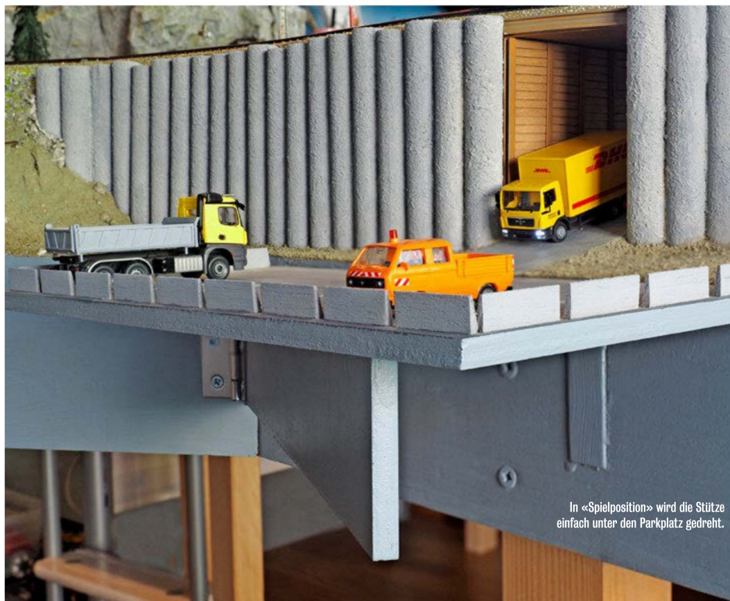
In «Spielposition» wird die Stütze einfach unter den Parkplatz gedreht.