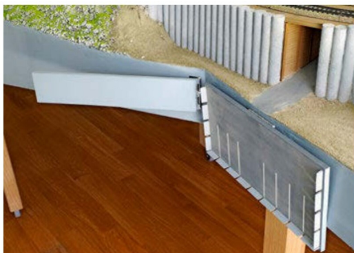
So sieht die platzsparende Montage des Park- und Wendeplatzes aus.