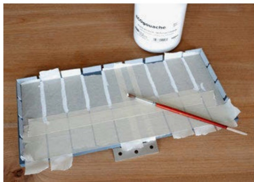
Das Feld ganz in der Mitte sollte zum Wenden jedoch frei bleiben.