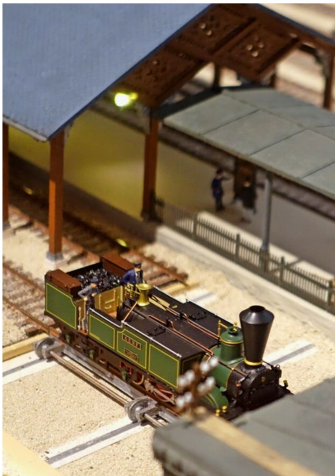
Die Schiebebühne am Gleisende wird verwendet, um die Lokomotiven platzsparend umzusetzen.