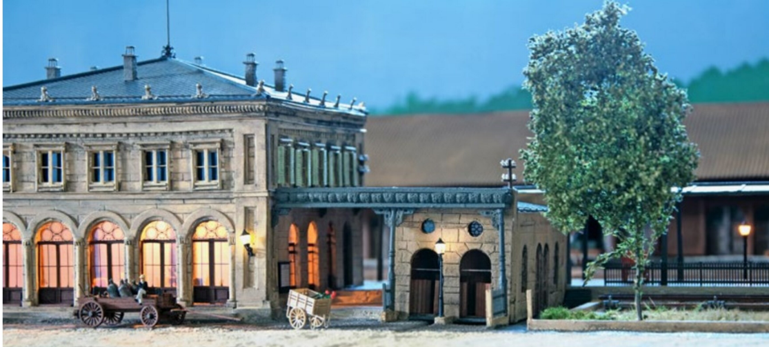
Die Filigranität der Fenster im Westflügel des Aufnahmegebäudes zeigt sich erst bei der in der Abendstimmung eingeschalteten Gebäudeinnenbeleuchtung.