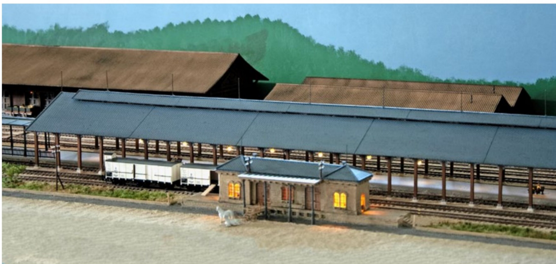
Im kleinen Post- und Eilgüterdepot der SCB werden Güter von deutschen Güterwagen für die Lieferung in der Stadt auf ein Pferdefuhrwerk umgeladen.