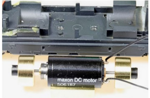
Die zukünftige Klebefläche sollte sorgfältig von Öl gereinigt werden.