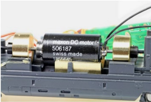
Der neue Motor samt Passstück ist exakt eingepasst und gut verklebt.