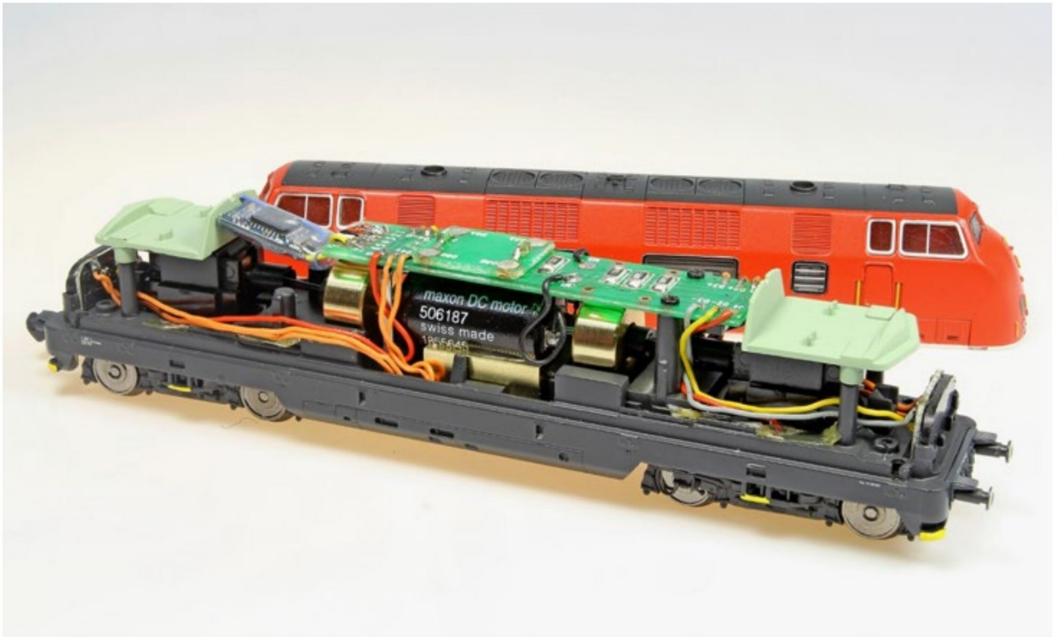
Geschafft! Die Lok ist bereit für einen ersten Probelauf. Mit dieser Motorisierung ist auch der Kaltstart garantiert emissionsfrei und ohne Qualm.