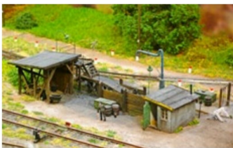
Die Kohlestation neben dem Depot.