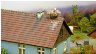
Stillleben mit Storchennest.

Was auffiel, war der grosse Variantenreichtum der gezeigten Anlagen: Von der Grossanlage in H0 bis zum Miniaturdiorama war alles vertreten. Ein würdiger und gesamtheitlicher Blick auf unser wunderschönes Hobby und eine wunderbare Geburtstagssüßereisung. ○