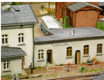
Bahnhofsgebäude der Regelspurbahn.