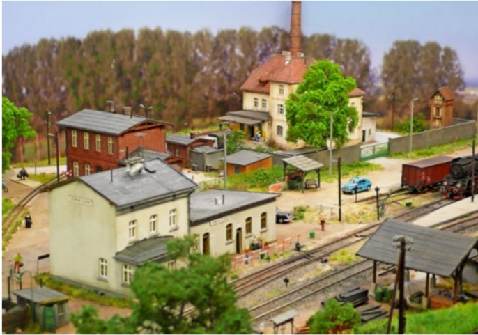
Endbahnhof der polnischen H0e-Anlage «From Lewin Leski to Bożepole Mazurskie».

Wenn man Glück hatte, dann wurde man sogar mit einem dieser süßen Energiehappen beschenkt. Natürlich stilecht mit der Schmalspurbahn angeliefert.