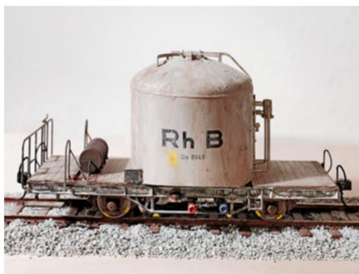
Nun macht er schon einen guten Eindruck, ist aber noch nicht fertig, denn es fehlen noch die markanten Rostspuren am Kessel.