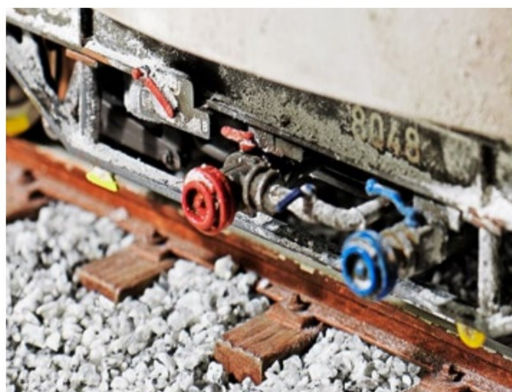
Natürlich braucht es auch auf dem Fahrwerk entsprechende Ablagerungen von Zement und Schmutz, und es darf nicht vergessen werden.