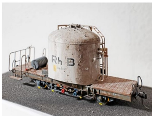
Der Uce 8048 ist auch mit «Zement» verschmutzt. Er erhält eine kleinere Menge, welche nach dem Trocknen abgebürstet wird.