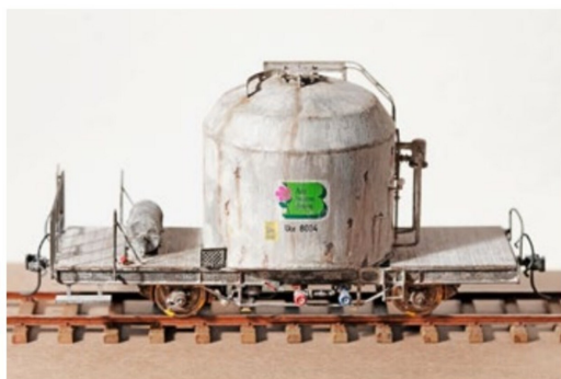
Mit dem abgebürsteten «Zement» und mit leichten Rostspuren am Kessel versehen, ist der optisch alte Uce 8004 bereits betriebsbereit.