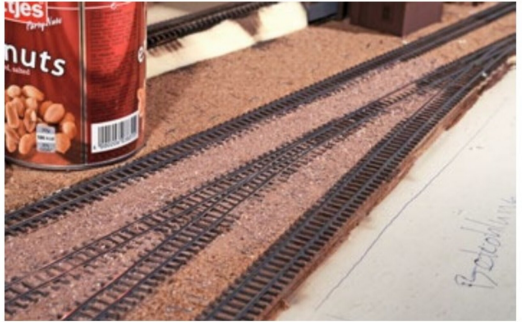
So sieht dann ein fertig grundierter Bereich erst mal aus.