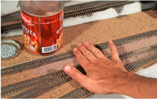
Vorsichtig wird der Sand mit den Fingern glatt gestrichen.