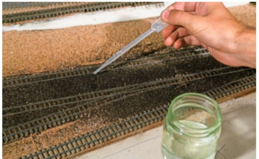
Der Schotter wird mit entspanntem Wasser befeuchtet ...