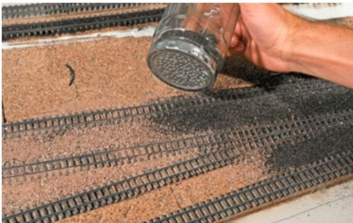
Streuer aus einem frisierten Konfitürenglas, um den Schotter zu verteilen.