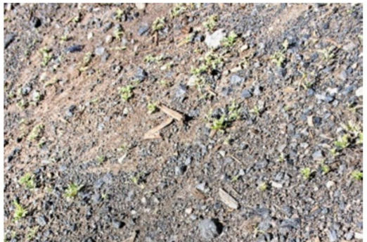
So sieht der Schotter im richtigen Chama Yard aus.