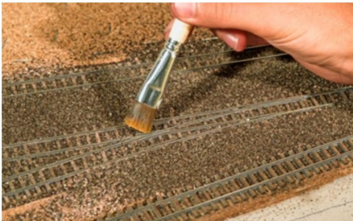
Mit einem Pinsel werden die wichtigen Teile der Weichen vom Sand befreit.