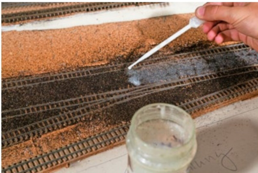
... und anschliessend mit verdünntem Weissleim fixiert.