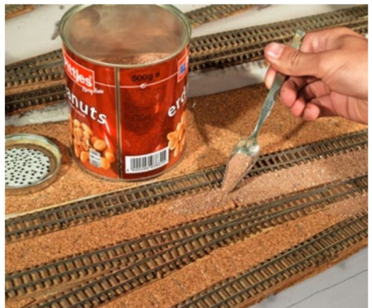
Der Grundierungssand wird mit einem präparierten Löffel aufgebracht.