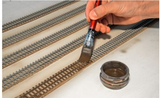
Die braungraue Lasur wird mittels eines weichen Pinsels aufgetragen.