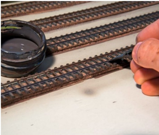
Die Schienenflanken werden mit einer entsprechenden Rostfarbe bemalt.