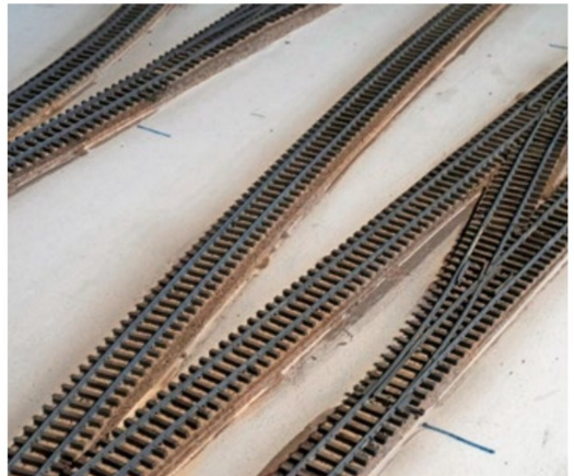
Die fertig gealterten Schienen im zukünftigen Bereich des «Freight House».