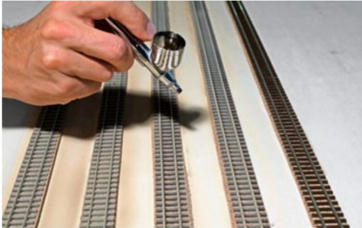
Mittels Airbrush werden die Gleise und Schwellen beige gespritzt.