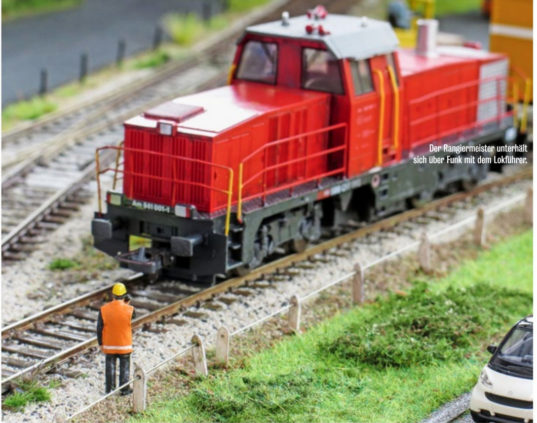
Der Rangiermeister unterhält sich über Funk mit dem Lokführer.