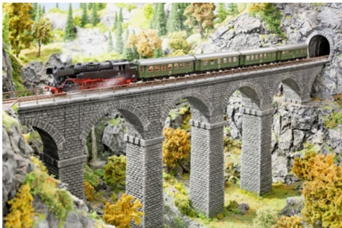
In Zusammenarbeit mit Roco entstand dieser Bausatz des Ravenna-Viaduktes.