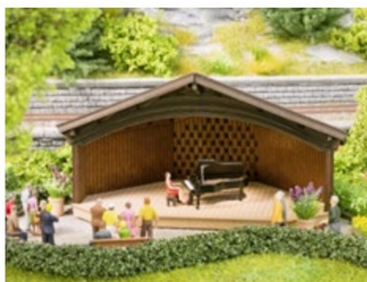
Für die Pianistin gibt es 20 Sekunden Beethoven.