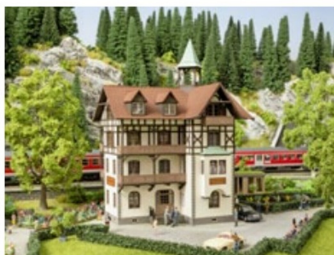
Romantisches Hotel und eine kleine Orangerie ...

Ausgebaut wird auch die Serie der Laser-Cut-Minis. Hier werden unter anderem ein Gemüsegartenset, ein Obstgartenset, eine Viehverladerampe, Grabsteine, Bordsteinkanten und Mauerabschlusssteinreihen für H0 angeboten. SK