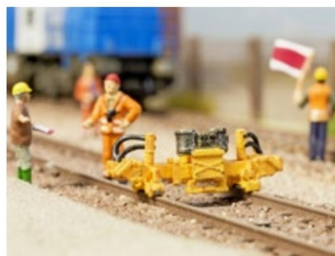
3-D-Druck-Minis: Serie von Gleisbaugeräten.