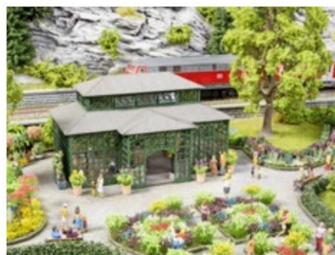
... aus feinem Architekturkarton gelasert.