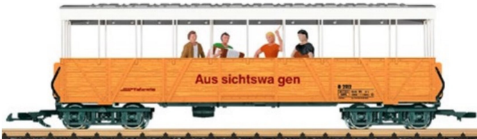
Hier wird es laut. Eine Absprache mit den Nachbarn scheint angemessen, bevor der Sound aufgedreht wird.