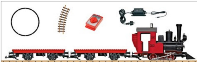
Eine Startpackung mit Bausteinwagen. Hier ist kindliche Kreativität absolut erwünscht.

Zuglokomotive ist eine HG 3/3 mit blau lackiertem Führerhaus und Wasserkästen. Auch diese Lok ist mit einem mfx/DCC-Decoder, erstmalig mit passendem Soundprojekt, ausgerüstet. Des Weiteren sind ein blauer zweiachsiger Personenwagen mit der Betriebsnummer B2228, ein roter, ebenfalls zweiachsiger Personenwagen (B2204) sowie ein offener Güterwagen (556) mit Beschriftungen passend für die Epoche V beigegeben.