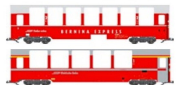
2 von insgesamt 6 Wagen für einen vollständigen BEX.