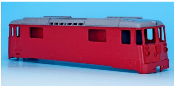
Es geht voran: Ein erstes Muster des Gehäuses der Ge 4/4 II war in der Vitrine von Bemo zu sehen.