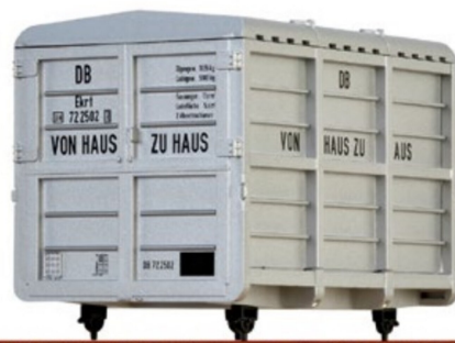
Zwei neue, einzeln erhältliche Mittelcontainer von Brawa. Hier wird wohl etwas Luft geholt, bevor weitere Wagenmodelle kommen.