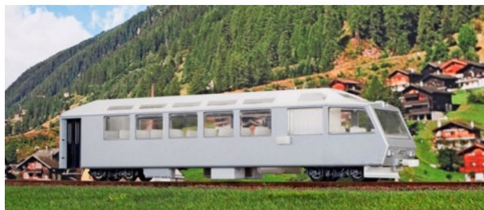
Für die moderne MOB steht der Steuerwagen Arst 116/117, der noch dieses Jahr in den Formenbau geht.

Neu im Sortiment der MGB sind ausserdem drei von der RhB übernommene Kesselwagen sowie ein für den Fahrradtransport genutzter gedeckter Güterwagen. Das Handarbeitsmodell der Zahnradampflokomotive HG 3/4 4 mit den vor einigen Jahren ergänzten roten Zierlinien in Diensten der DFB ist ebenfalls eine Lokneuheit des Programms.