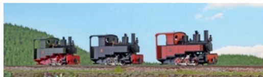
Auch Dreiachsler gab es für die Feldbahngleise: die Decauville Progress.