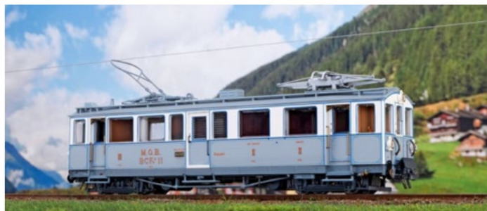
Kurz vor der Auslieferung steht der Nostalgie-Triebwagen BCFe 4/4 der MOB mit der Nummer 11.