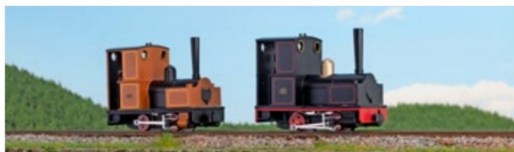
Richtig putzig und auch etwas exotisch: die Bagnall-Wingtank-Maschinen.