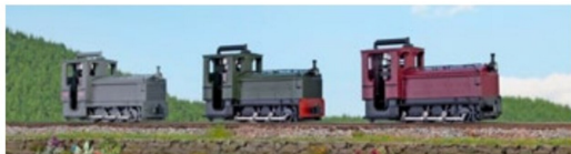
... mindestens ebenso bekannt: die Schneider Locotracteur.