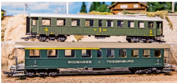
Auch der AB 101 lässt sich aus einem Spenderwagen von Roco umbauen.

biegen es nur leicht nach den angegebenen Massen. Diese Teile verlöten wir nun und bohren für die 8 mm hohen Stücke Löcher in den Wagenbogen jeweils 75 mm vom Wagenende entfernt.