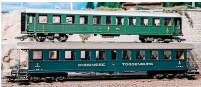
Der fertig umgebaute B 302 zeigt sich mit dem Spenderwagen von Roco.