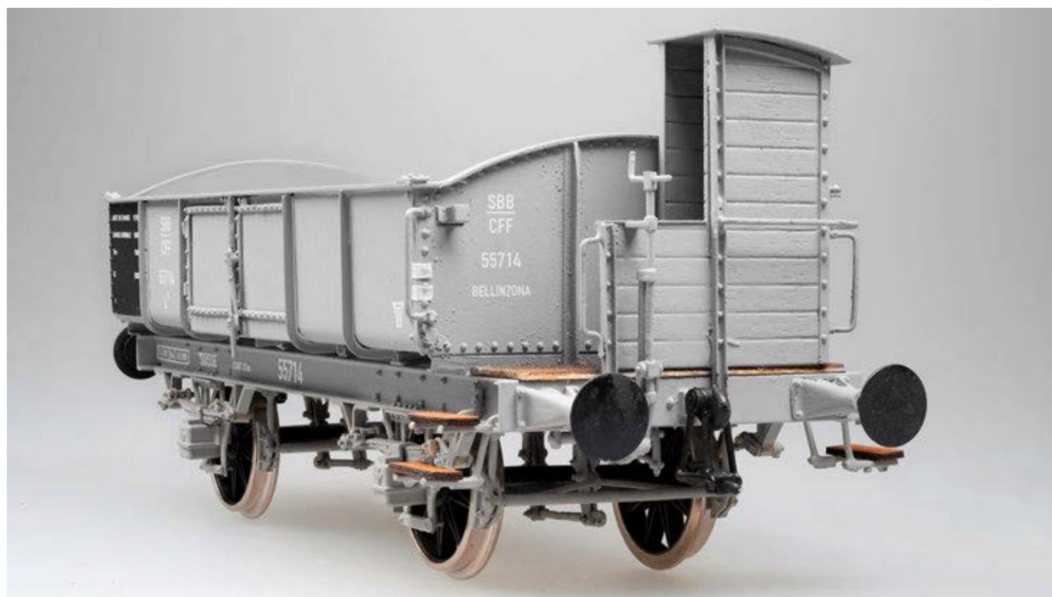
Die Verbletterung des Bremserhauses, der Belag der Bühne und die Tritte bestehen aus feinem Flugzeugsperrholz.