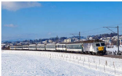
Der bunt zusammengewürfelte Narrenzug beim Kloster Wurstbach zwischen Rapperswil und Bollingen auf seiner Fahrt in Richtung Wattwil mit Ziel Urdorf.