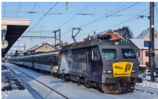
Die Re 446 017 wartet mit ihrem bunt zusammengewürfelten Sonderzug auf die Weiterfahrt. Die Lok wurde eigens für die Fahrt mit einem Transparent bestückt.