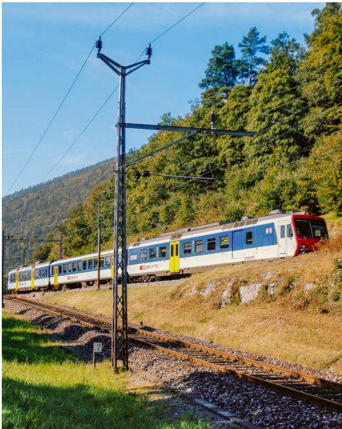
Diese Aufnahme soll die Neigungsverhältnisse der Strecken dokumentieren. Ein NPZ der SBB ist auf dem Weg von Chambrelieu nach Le Locle.