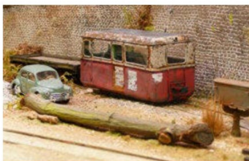
... ein kleiner Traum aus Frankreich in Spur Oe.