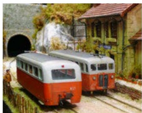
St. Frézal de Ventalon von Bernard Junk...