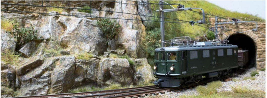
Auf der rechten Seite der Anlage verlässt gerade ein Güterzug den Tunnel. Er kommt von der mittleren Ebene über die äussere Wendel im Berg.