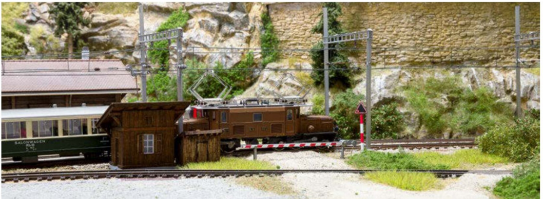
Der Gegenzug mit der Ge 6/6 I und ihren Salonwagen kann die Station direkt nach Einfahrt des Güterzuges bergwärts verlassen.