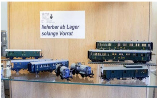
Die Vitrine vom Modellbaustudio Born: Modelle, die aktuell lieferbar sind.