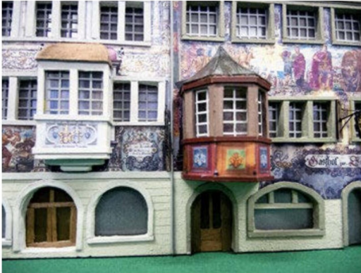
... Reussufer fort. Die Fassaden glänzen durch ihre reiche Farbfassung.