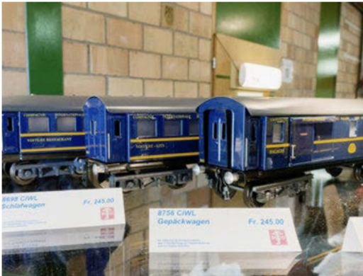
CIWL-Wagen in Tinplate-Ausführung von Bucu Spur 0 GmbH.