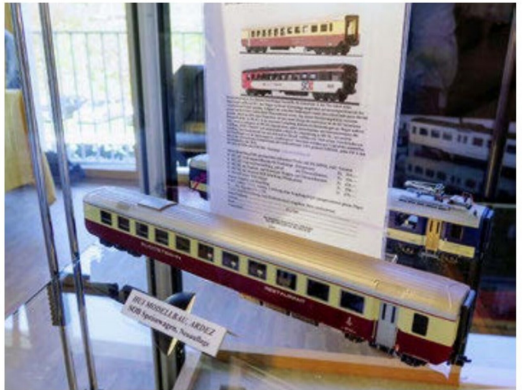
Am Stand von Hui-Modellbau war dieses Muster eines WR 242 der SOB zu sehen.