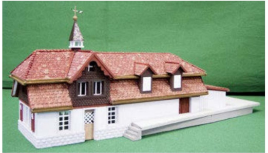
Auch am Stand von Tip-Top-Modell zu sehen: das Empfangsgebäude von Büren.