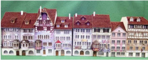
Tip-Top-Modell aus Basel setzt die Serie der Luzerner Stadthäuser am ...