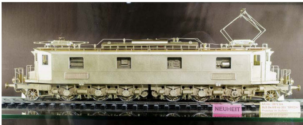
Am gewohnten Platz im Treppenhaus des Schulgebäudes präsentierte Fulgurex seine neusten Modelle. Hier die BLS Be 6/8 no 203 «BREDAL» für Spur 0.