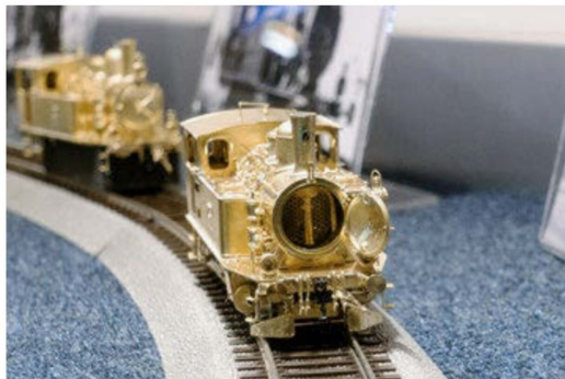
H-R-F-Modellbahn-Atelier präsentierte den aktuellen Produktionsstand ...