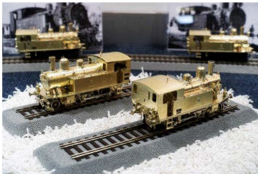
... der verschiedenen Varianten der Ed 3/4 im Massstab 1:87.