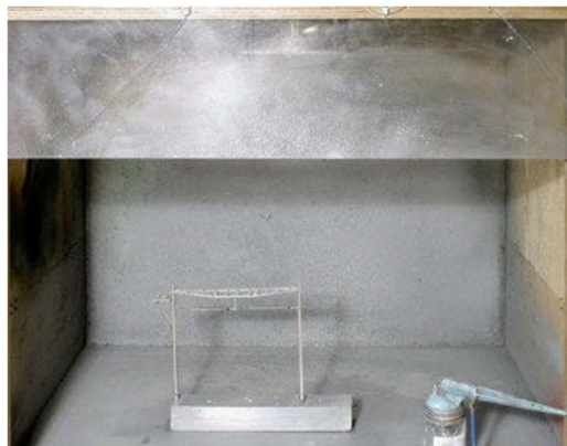
In der Spritzkabine erhalten die Masten ihr Farbkleid.