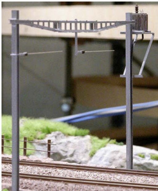
Ein weiterer Sonderfall: ein Masttrafo an einem Oberleitungsjoch.

drahthalter gelötet. Anschliessend muss die korrekte Fahrdrathlage mit verschiedenen Loks kontrolliert werden. Erst wenn alle Fahrzeuge mit angehobenem Pantografen unfallfrei die Strecke befahren können, kann mit dem nächsten Arbeitsschritt begonnen werden.