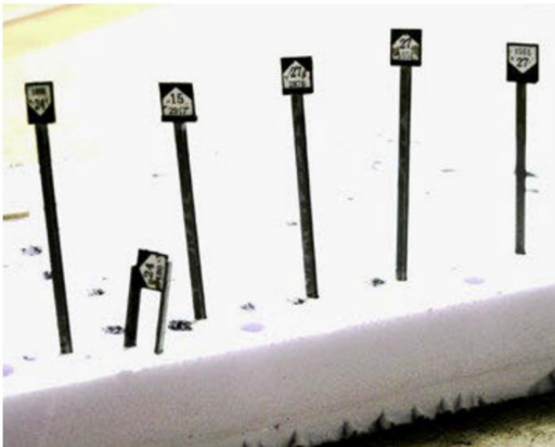
Verschiedene Neigungszeiger; die Zahlen entsprechen dem Vorbild.