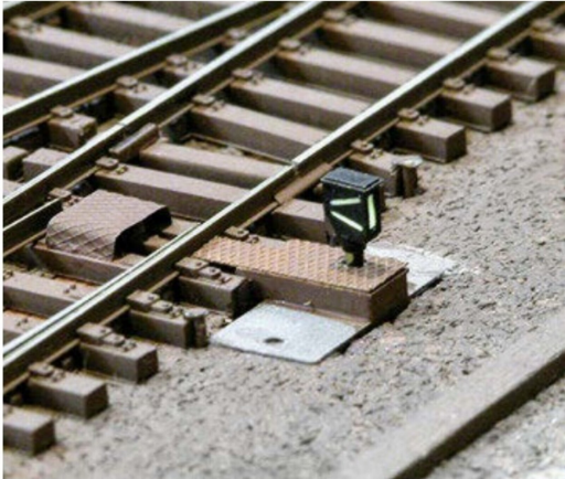
Alle Weichen haben auch die obligatorischen Abdeckbleche erhalten.