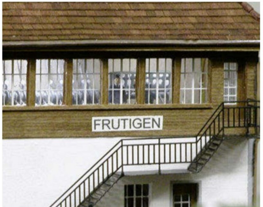
Rangierstellwerk im Bahnhof Frutigen mit Inneneinrichtung und Beleuchtung.