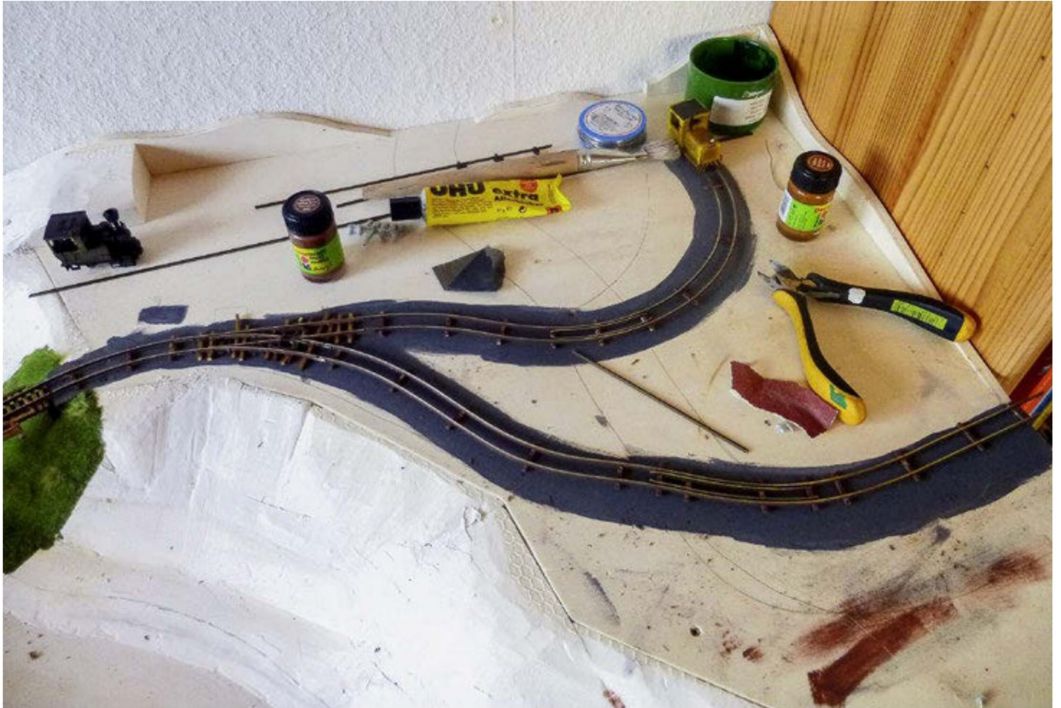
Im Bereich der Gleislage wurde schon mal etwas Farbe aufgetragen, anschliessend konnten die Gleise direkt auf das Styrodur montiert werden.