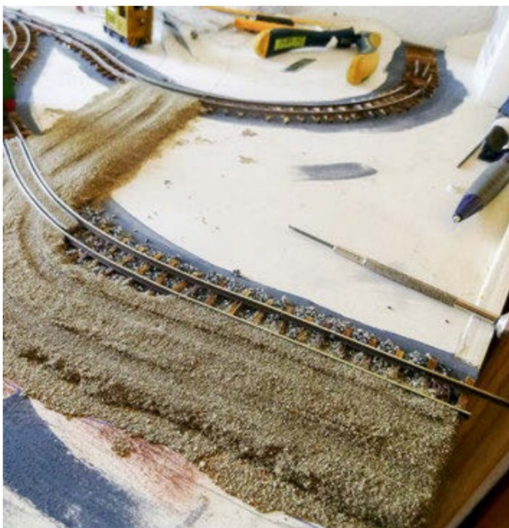
Der Feldweg entstand aus einem Sand-Leim-Gemisch ...