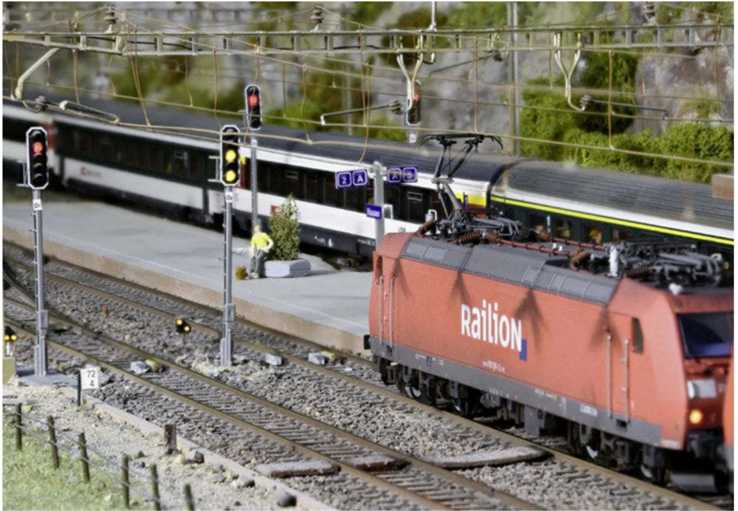
Während der Interregio den Bahnhof Wassen über Gleis 3 bereits wieder verlässt, zeigt das Signal für den Containerzug Fahrbeginn 6.