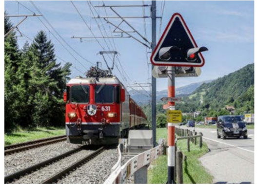
Zwischen den RhB-Stationen Domat-Ems und Reichenau-Tamins befindet sich dieser mit Bahnschranken und Wechselblinkern ausgestattete Übergang. Auf den beiden Fotos ist das wechselnde Blinklicht und die Konstruktion der Schrankenbäume gut ersichtlich.