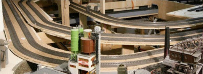
Die Gründer haben sich vorgenommen, eine Anlage für viel Fahrbetrieb zu bauen. Sie haben Wort...