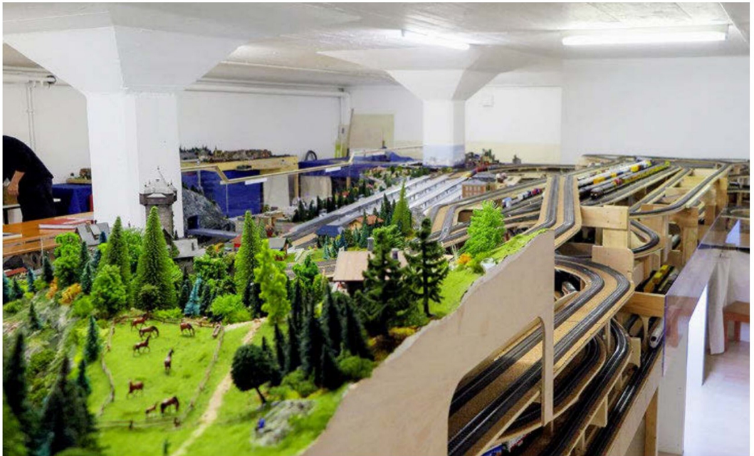
Überblick über den südlichen Anlagenteil, wo noch einiges an «Baulandreserve» vorhanden ist. Für viel Bauspass ist auch in den nächsten Jahren gesorgt.