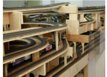
...gehalten, wie die Gleisführungen verraten.