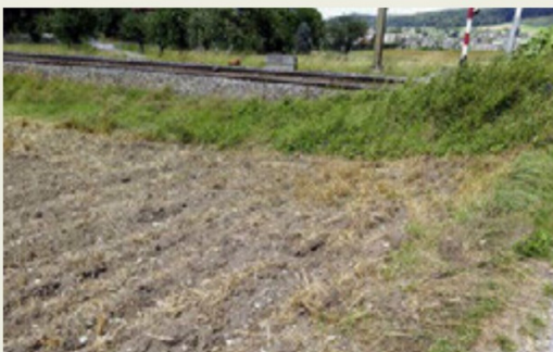
Nahaufnahme eines gerade gepflügten Ackers.

Grasstreifen von Heki, Noch oder Silhouette eignen sich bestens zur Nachbildung von Reihen frisch gepflanzten Gemüses. Die Streifen sind für verschiedene Baugrößen erhältlich. Noch hat in den letzten Jahren auch seine Reihe mit den Lasercut-Minis für die Baugrößen N, TT und H0 ausgebaut. Es werden verschiedene Packungen mit Pflanzen und Zäunen oder Bohnenstangen für das Gemüsebeet angeboten. Alle