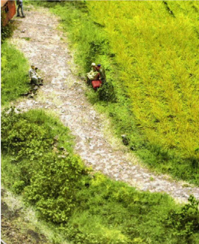
Eine ländliche Szene mit einem Getreidefeld auf einem Diorama der Firma Heki.

material verwendet (Auhagen, Bestell-Nr.: 76941 oder 76942).