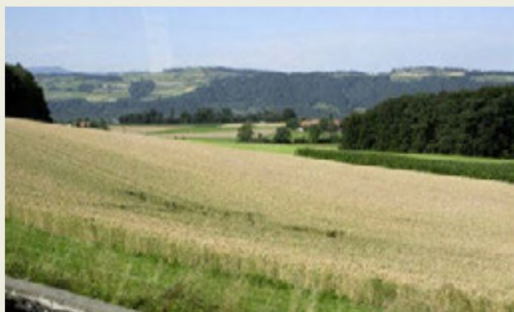
Kornfelder am 6. Juli 2011 in der Region Emmental.