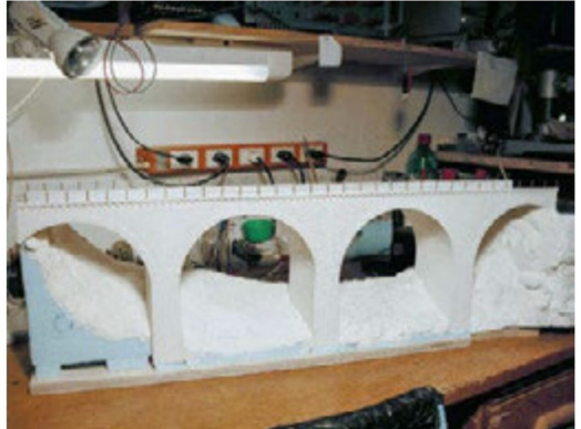
Der Rohbau, inklusive des Geländes und der Brückengeländer, ist vollendet.