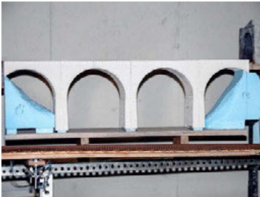
Eine erste Stellprobe auf der Anlage und die ersten Landschaftsformen.