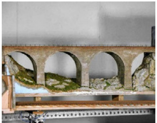
Das fertige Viadukt an seinem Einbauort auf der Anlage.