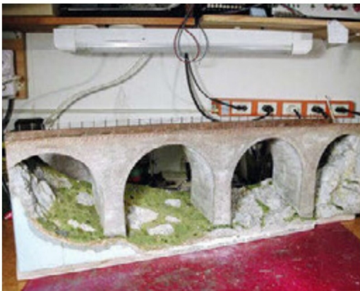
Es folgt die farbliche Gestaltung und die Nachbildung der Flora.