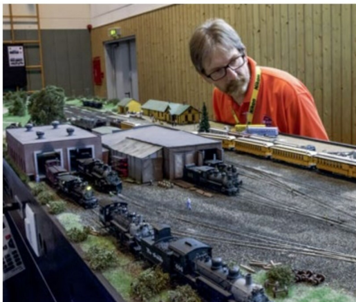
Nach seinem humoristischen FO-Beitrag nimmt es Ferdi Rat von den AMORS bei den amerikanischen Modellen aber ganz genau.