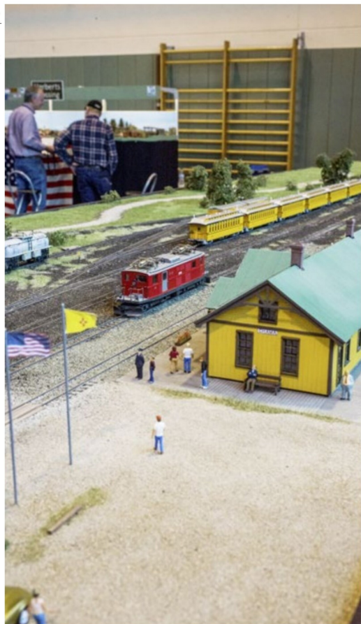
«Chama» zieht in Rodgau viele Schweizer Besucher an. Manchmal sogar Lokomotiven. Ferdi Rat hat diese FO HGe 4/4 1 auf H0n3 umgespurt.