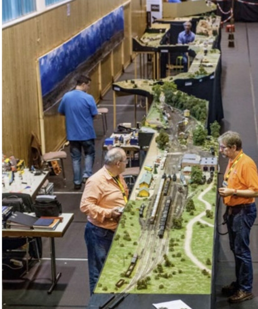
Übersicht über die Situation an der Convention in Rodgau. Im Hintergrund die modulare Fahrstrecke der AMORS. Am unteren Bildrand ist das infolge fehlenden Gleisdreiecks eingesetzte «Schiffchen» zum Drehen der Loks sichtbar.