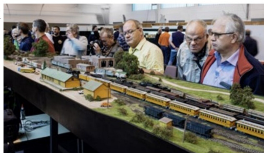
Der Chama Yard im Massstab 1:87 war in Rodgau optisch und betrieblich ein starker Publikumsmagnet.